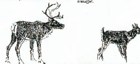
Simle. Geviret er mer kvartet og med en knokk over på gevirstammen.